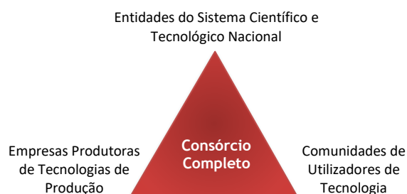
Figura 2 – Triângulo Virtuoso da Inovação Tecnológica