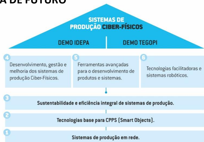
Figura 1 - Estrutura do Projeto